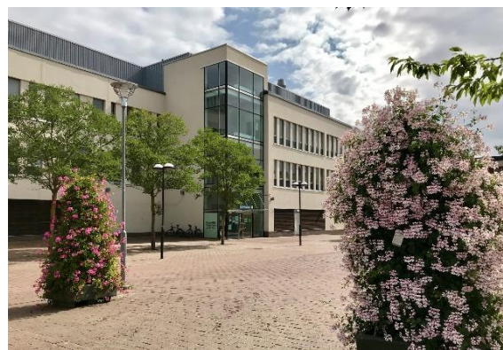
Röda Korsets folkhögskola i Skärholmen

På Röda Korsets folkhögskola gavs vid årets slut elva olika kurser. Fem av dessa gavs på allmän kurs och motsvarar olika nivåer på grund- och gymnasieskolan, varav en var på distans. Under beteckningen särskild kurs gavs sex kurser, samtliga helårskurser varav två på distans samt två kurser på deltid/distans. En av de särskilda kurserna var på grundläggande nivå med fokus på framtida studier och eller arbete för i huvudsak korttidsutbildade utrikes födda personer. Utöver detta hade vi ett fåtal deltagare registrerade i insatsen svenska från dag ett. Under vårterminen hade vi tre grupper studerande inom projektet Care of Folkbildningen som riktade sig till ukrainska flyktingar som omfattades av massflyktsdirektivet.