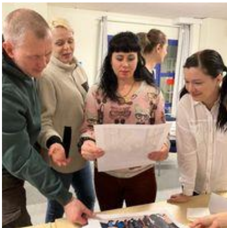
Deltagare på Care

Folkhögskolan har en rad olika arbetsmarknadsuppdrag som administreras genom Arbetsförmedlingen som till exempel Studiemotiverade folkhögskolekurs och Etableringskurs. Röda Korsets Folkhögskola har tidigare bedrivit Studiemotiverande Folkhögskolekurs i större skala men under 2023 fick vi enbart fyra anvisningar vilket gör det svårt att planera för denna kurs. Det är väldigt synd då den kursen når en målgrupp som lämpar sig bra för folkhögskolestudier och som i väldigt hög utsträckning går vidare till studier eller arbete efter avslutad insats.