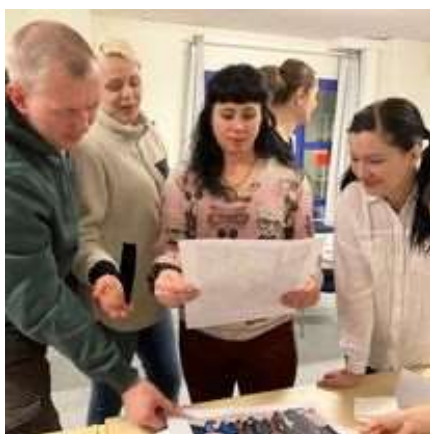
Deltagare på Care

Folkhögskolan har en rad olika arbetsmarknadsuppdrag som administreras genom Arbetsförmedlingen som till exempel Studiemotiverade folkhögskolekurs och Etableringskurs. Röda Korsets Folkhögskola har tidigare bedrivit Studiemotiverande Folkhögskolekurs i större skala men under 2023 fick vi enbart fyra anvisningar vilket gör det svårt att planera för denna kurs. Det är väldigt synd då den kursen når en målgrupp som lämpar sig bra för folkhögskolestudier och som i väldigt hög utsträckning går vidare till studier eller arbete efter avslutad insats.