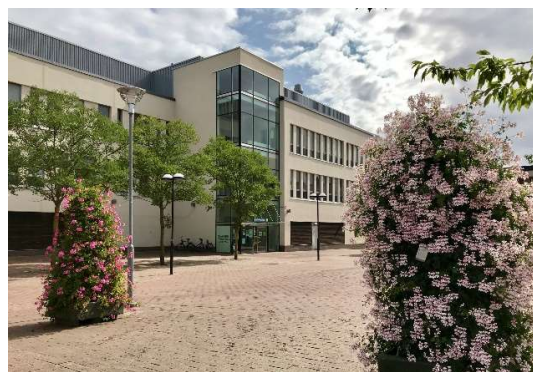
Röda Korsets folkhögskola i Skärholmen

På Röda Korsets folkhögskola gavs vid årets slut elva olika kurser. Fem av dessa gavs på allmän kurs och motsvarar olika nivåer på grund- och gymnasieskolan, varav en var på distans. Under beteckningen särskild kurs gavs sex kurser, samtliga helårskurser varav två på distans samt två kurser på deltid/distans. En av de särskilda kurserna var på grundläggande nivå med fokus på framtida studier och eller arbete för i huvudsak korttidsutbildade utrikes födda personer. Utöver detta hade vi ett fåtal deltagare registrerade i insatsen svenska från dag ett. Under vårterminen hade vi tre grupper studerande inom projektet Care of Folkbildningen som riktade sig till ukrainska flyktingar som omfattades av massflyktsdirektivet.